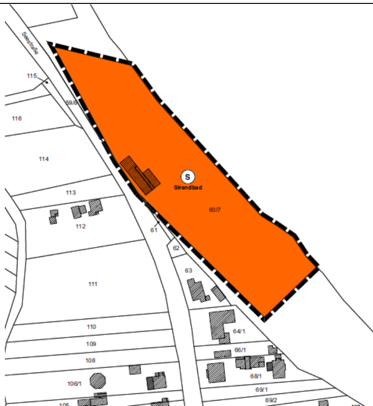
Geltungsbereich der 7. Änderung des Flächennutzungsplans - Vorentwurf